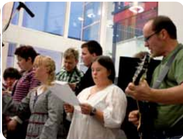
DUV i Västra Nylands band Trixstar uppträdde på examensfesten vid Axxell i Karis.

Den 28.2.2012 firade 14 examinander vid Axxell i Karis avslutningsfest. De har under 1,5 år studerat yrkesexamen inom omsorgsarbete för utvecklingsstörda. I festen deltog representanter för arbetslivet och DUV i Västra Nylands band Trixstar uppträdde.