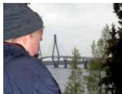
Friluftsdag vid Replotbron, sid 17