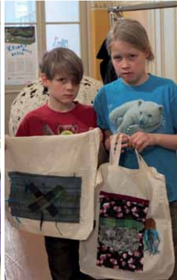
Nemo och Elva har tillverkat fina tygkassar.