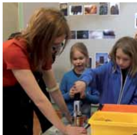
Fest för alla barn, sid 12