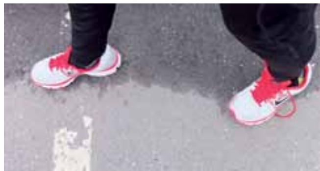
En halvmaraton, alltså 21 kilometer, är cirka 35 000 steg.