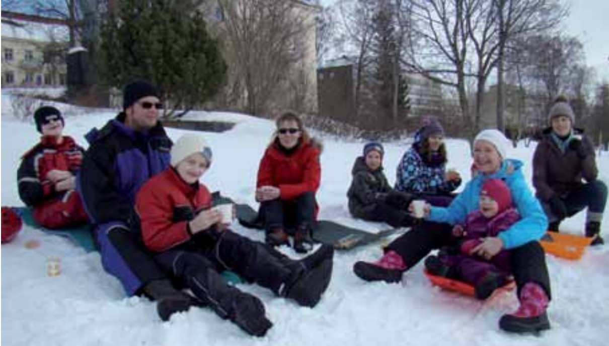
Hela gänget har saftpaus i backen.