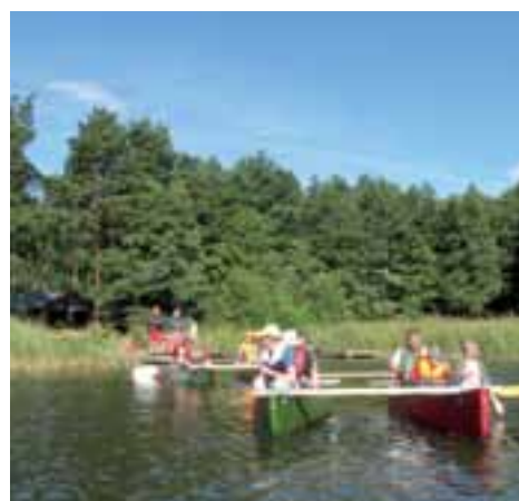
Paddling som passar alla, sid 4 Lättläst