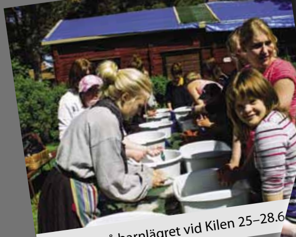
Tovning på barnlägret vid Kilen 25–28.6