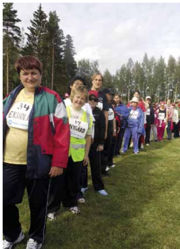
Kön till stövelkastningen blev lång.

–Det blev sammanlagt över 300 starter i tio olika grenar. Vi har en väldigt fin förening med bra talkoanda, så det har egentligen inte varit svårt att få folk att ställa upp.