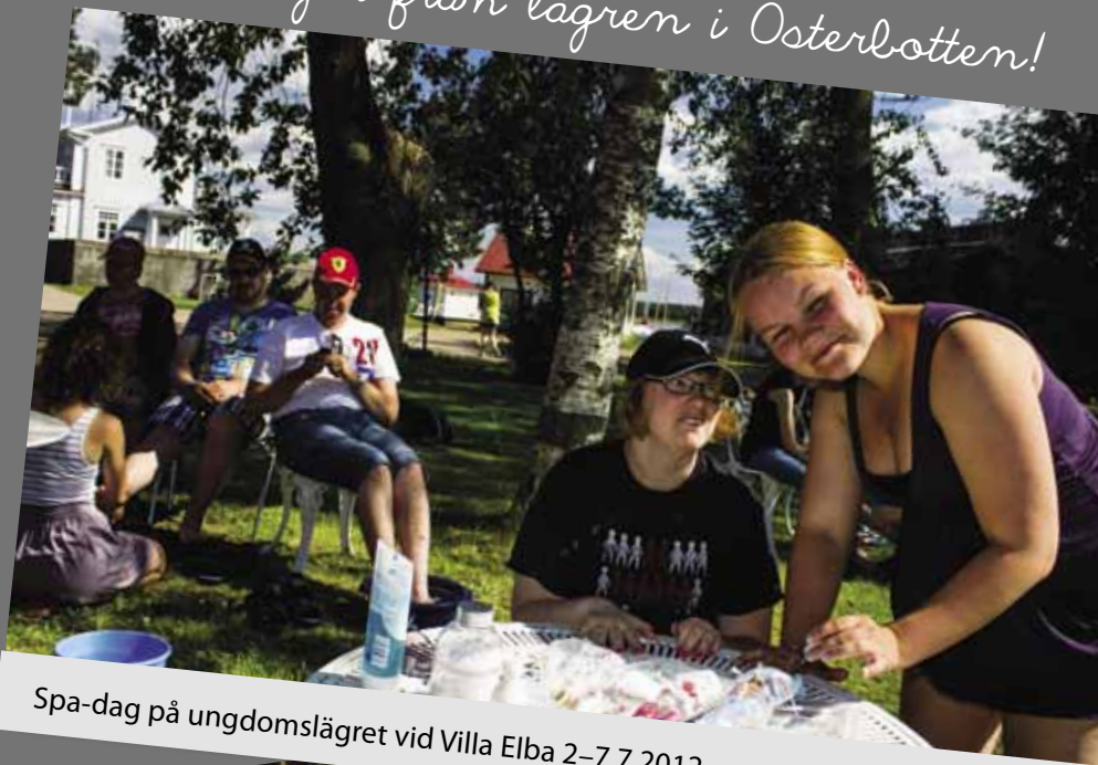
Spa-dag på ungdomslägret vid Villa Elba 2–7.7.2012.