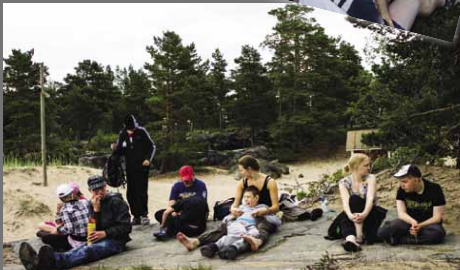
Merilä barnläger besöker Pörkenäs strand.