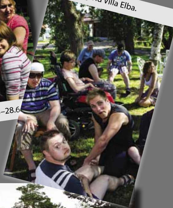
Spa-dag vid Villa Elba.