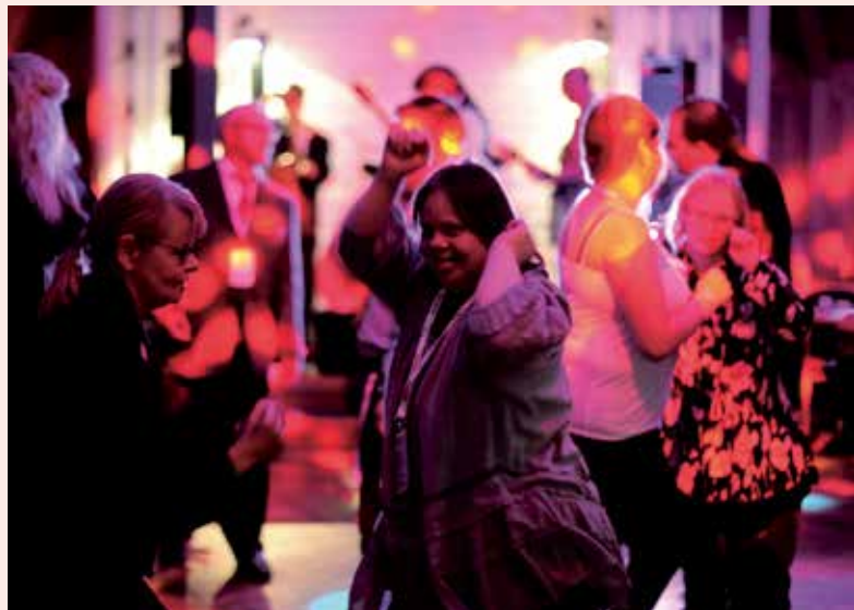
På Storträffen blir det dans till livemusik.

Information om de lokala gruppernas träffar under hösten hittar du på www.stegforsteg.fi .