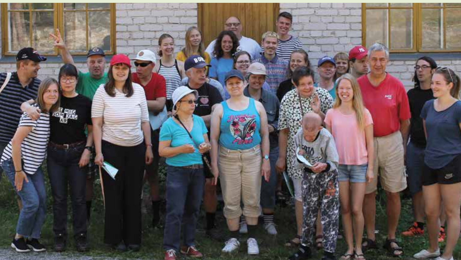
Skärgårdsläger på Kirjais. Gruppfoto.