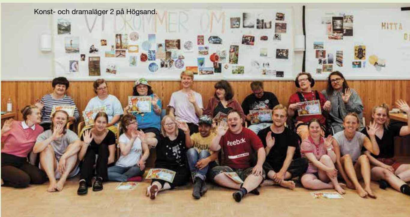
Konst- och dramaläger 2 på Högsand.