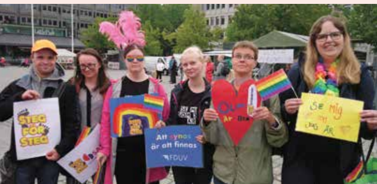
Steg för Steg deltog i Vasa Pride.