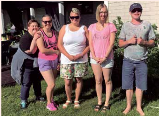
Steg för Steg på Åland hade grillfest.