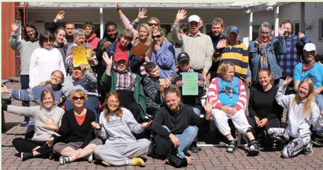
Vi ses på Högsand. Gruppfoto.