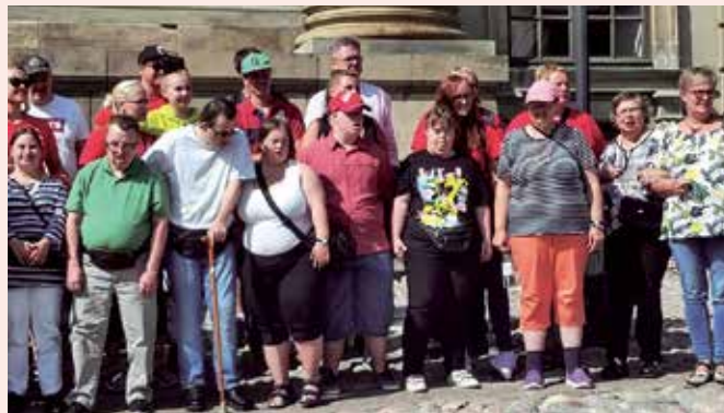
Sverigeresenärer. Resan till Sverige företogs i början av augusti.

Nu börjar igen klubbverksamheten, Teater Magnitude, Trixstar (vårt band) och Showstar (vår kör). Sportklubben har blivit så populär, så Jesper har delat in deltagarna i tre olika kategorier, så var och en får ut så mycket som möjligt. Också Amazing Västnyland hör till programmet.