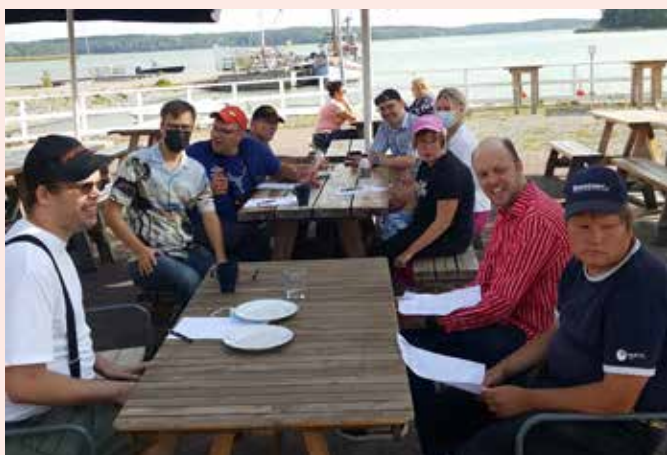
Skärigänget träffades på café vid Gästhamnen i Pargas.