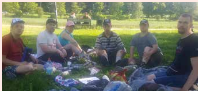
Borgåschacket var på picknick i parken Maren i Borgå.