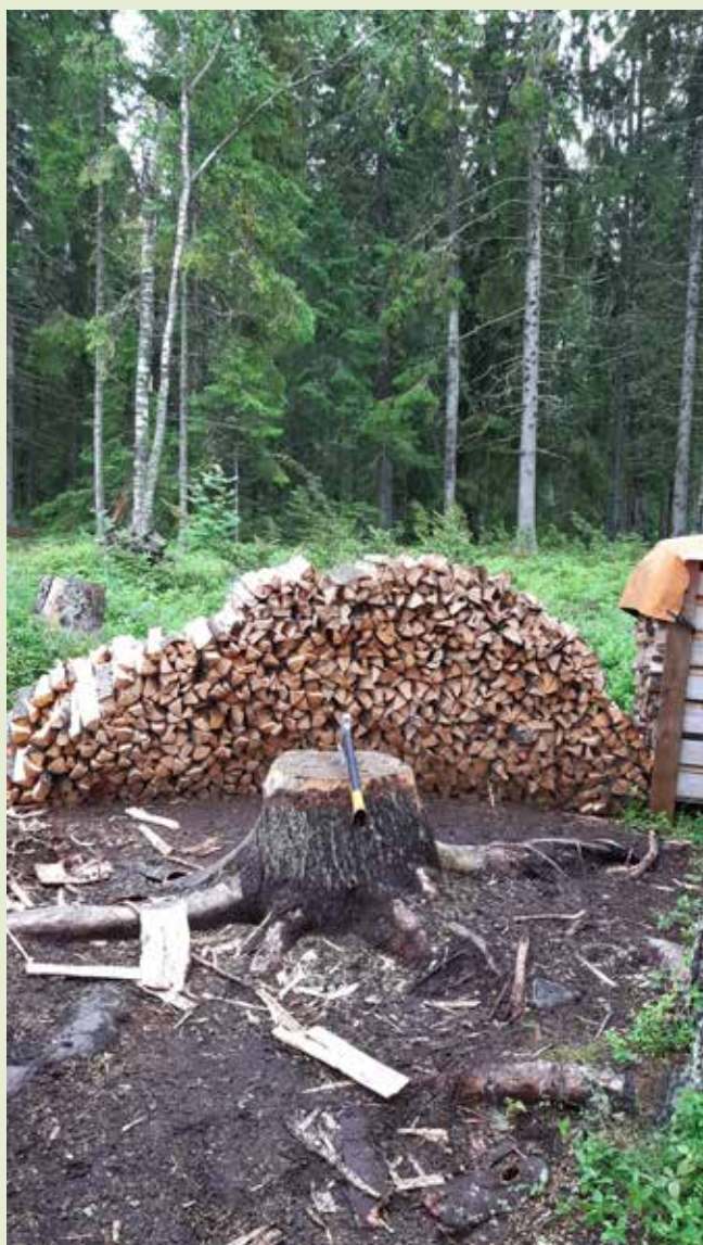
Om fotot: "Vedjobb."