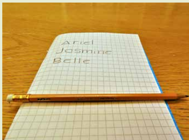
Om fotot: "Min vardag är att skriva i häften."