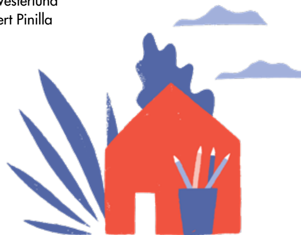
Illustration: Albert Pinilla