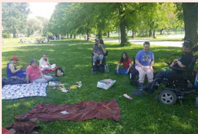
Auragänget hade picknick i Kuppisparken i Åbo på årets varmaste dag.