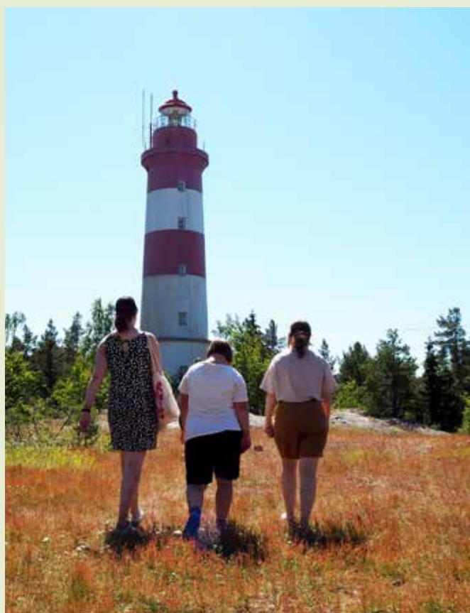
Skattjakt vid Sälgrunds gamla lotsstation i Kaskö. →