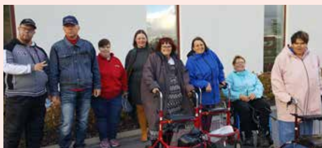
När-gruppen träffades i Närpes i augusti.