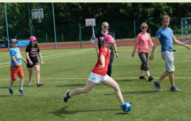
Fartfyllt barnläger på Solvalla.