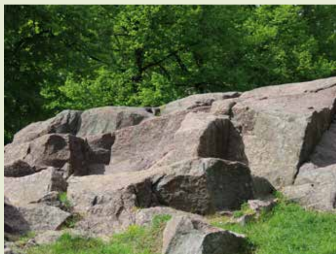
Om fotot: "Klippor är vackra att se på och att gå på."