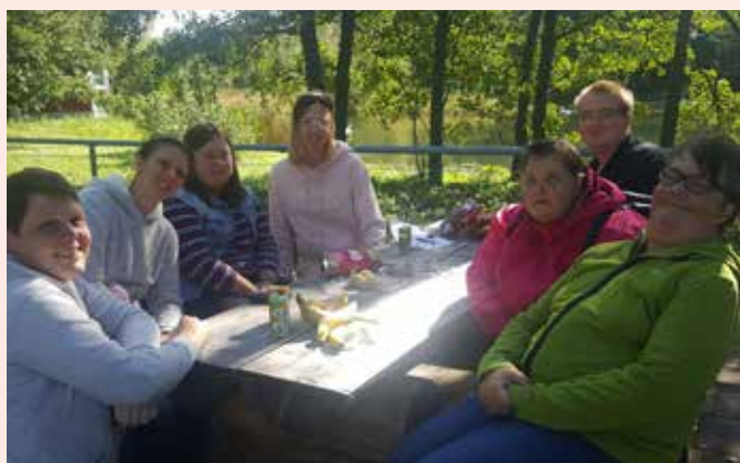
Ett Steg i taget för Åland hade sommarträff på Lilla Holmen i Mariehamn.

Här är bilder från en del av våra sommarträffar.