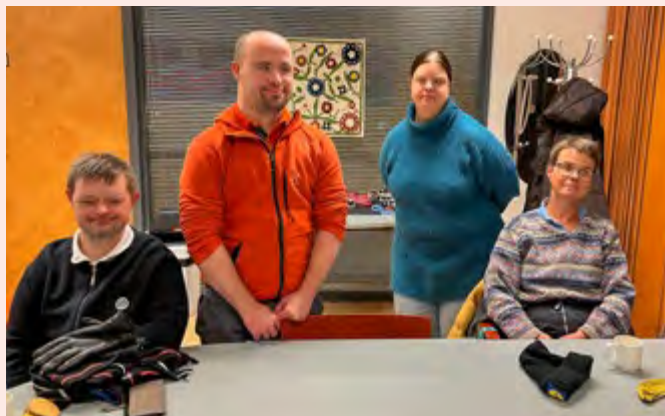
Lokala gruppen KoVa-gänget träffades i Vasa

Våra lokala grupper har hållit sina första träffar för året och planerat vårens verksamhet. Vi ordnar bland annat en diskussionsträff om assistans i Borgå den 15 februari, och diskuterar servicen i välfärdsområdet med inbjuden gäst i Ekenäs den 12 mars.