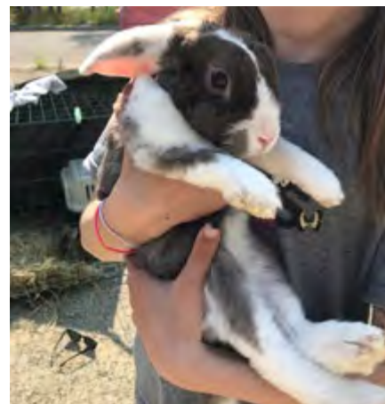
Som en del av vårt samarbete har vi besökt 4H:s kaninläger.

Ansökan till sommarens läger är öppen till och med den 29 februari. Läs mer och ansök om plats på fduv.fi/lager .