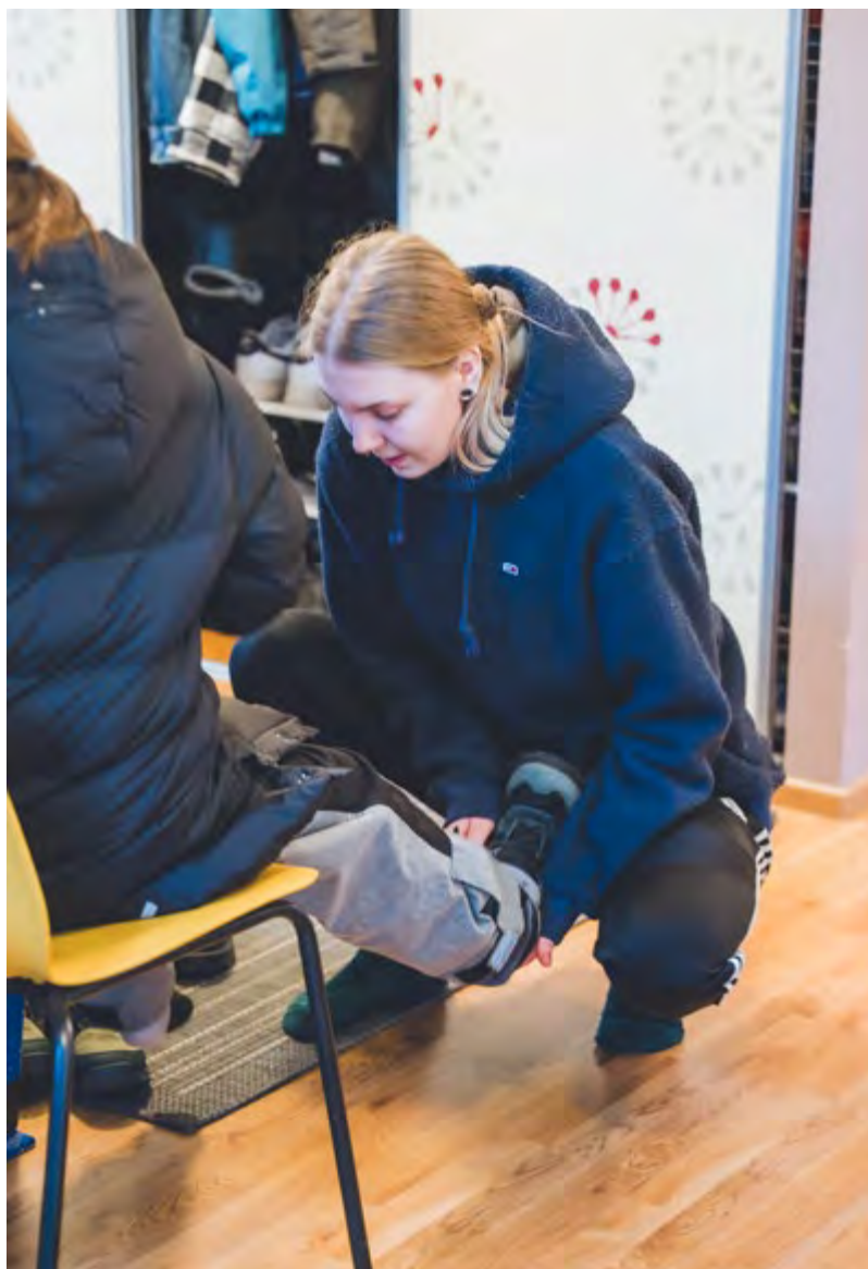
Tindra har blivit en viktig del av Maias liv.