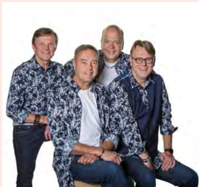
På dansgalan i mars får vi dansa till tonerna av orkestern Tomas Fantz.

Årsmöte hålls onsdagen den 27 mars kl. 18.30 på DUV:s kansli i Vasa. Stadgeenliga ärenden och kaffeservering.