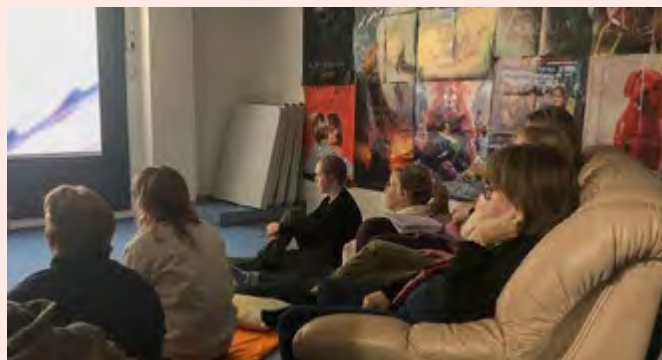
Filmkväll på Duvan.

Teater Magnitude fortsätter sina träffar och övar för tillfället på pjäsen Skönheten och odjuret . Premiären är den 11 april på Tryckeriteatern, med föreställningar även den 13:e, 14:e, 18:e, 19:e och 20:e april.